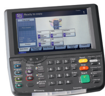
Com desenho novo, painel de controle com tela de toque colorida grande e fácil de usar