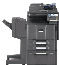
Apresentado com DSDP opcional para 175 folhas e bandejas de papel de 1.500 x 2 folhas e alceador para 1.000 folhas