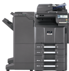
Apresentado com DSDP opcional para 175 folhas e bandejas de papel de 500 x 2 folhas e alceador para 4.000 folhas